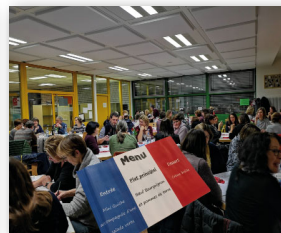
Einladung der Lehrerschaft zum Festmenü für die Mensaköche.