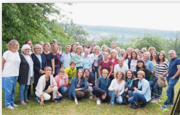
Die Kochgruppen gemeinsam unterwegs beim alljährlichen Sommerfest.

Die essbar ist immer in Bewegung, denn verlassen die Kinder die Schule mit dem Abitur oder aus anderen Gründen, geht meist auch für die Mensaköche und Ausschuss-Mitglieder die Zeit zu Ende. Deshalb sind wir immer auf der Suche, um neue, tatkräftige Unterstützung für die essbar zu finden.